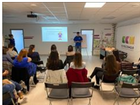
"Школа первой помощи детям", Краснодарский край 15 декабря 2019 года

Мероприятие: Обучение родителей и лиц, осуществляющих уход, присмотр за детьми алгоритмам и навыкам оказания первой помощи детям при различных ЧП. Популяризация семейных ценностей, культуры безопасности