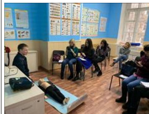
"Школа первой помощи детям", Свердловская область 12 февраля