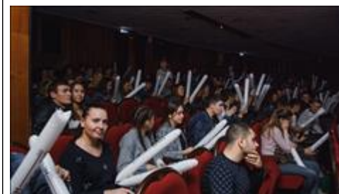
Проведение "Школы первой помощи детям" в рамках региональной премии "Крыммолодежный". Регион проведения: Республика Крым