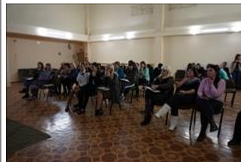
"Школа первой помощи детям", Республика Крым 17 февраля 2020 года