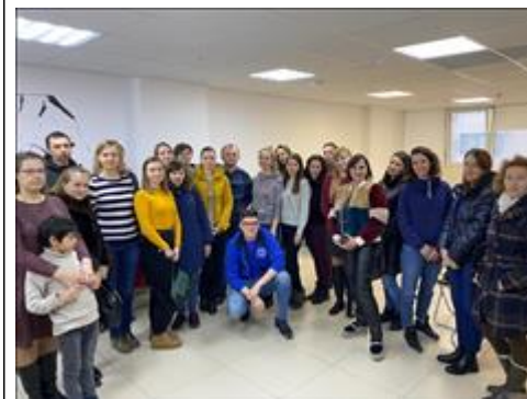
"Школа первой помощи детям", Краснодарский край 25 декабря 2019 года