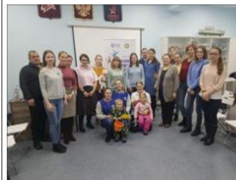
"Школа первой помощи детям", Архангельская область 18 января 2020 года