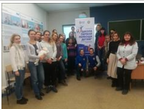
"Школа первой помощи детям", Архангельская область 1 февраля 2020 года