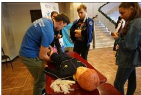
Проведение "Школы первой помощи детям" в рамках региональной премии "Крыммолодежный". Регион проведения: Республика Крым