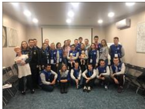
Обучение и аттестация добровольцев-инструкторов "Школы первой помощи детям " Аттестованные добровольцы-инструкторы "Школы первой помощи детям"

Мероприятие: и соответствующая аттестация добровольцев-будущих спасателей для реализации программы "Школа первой помощи детям"