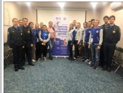
Обучение и аттестация добровольцев-инструкторов "Школы первой помощи детям" Аттестованные добровольцы-инструкторы

Фотографии с мероприятий, проведенных в отчетном периоде, а также видео- и аудиозаписи (если такие записи производились Грантополучателем) выступлений (докладов) участников, оплата выступления и (или) проезд, проживание, питание которых осуществлялись за счет средств гранта (при условии, что такие фотографии, записи не содержатся в публикациях, материалах, указанных в подпункте 5 настоящего пункта)