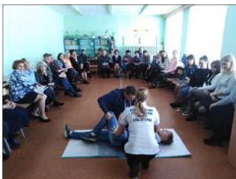
"Школа первой помощи детям", Архангельская область 21 декабря 2019 года