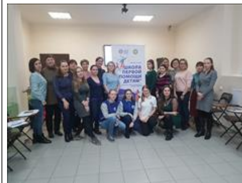
"Школа первой помощи детям", Архангельская область 25 января 2020 года

Мероприятие: Участие не менее чем в 3 городских мероприятиях, праздниках в каждом из 5 регионов реализации проекта