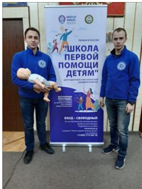
ролл-ап ролл-ап для добровольцев из Краснодарского края