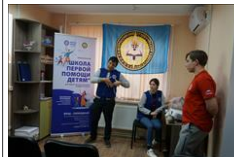
ролл-ап ролл-ап для добровольцев из Республики Крым