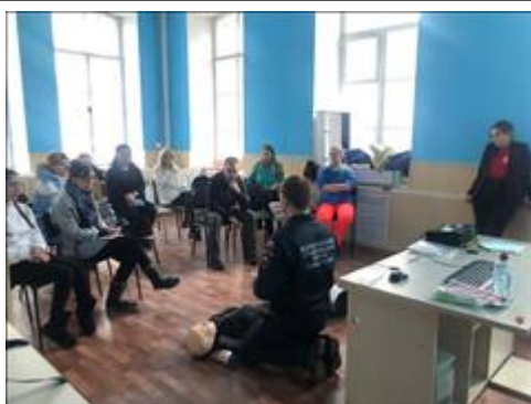
"Школа первой помощи детям", Свердловская область 26 февраля 2020 года