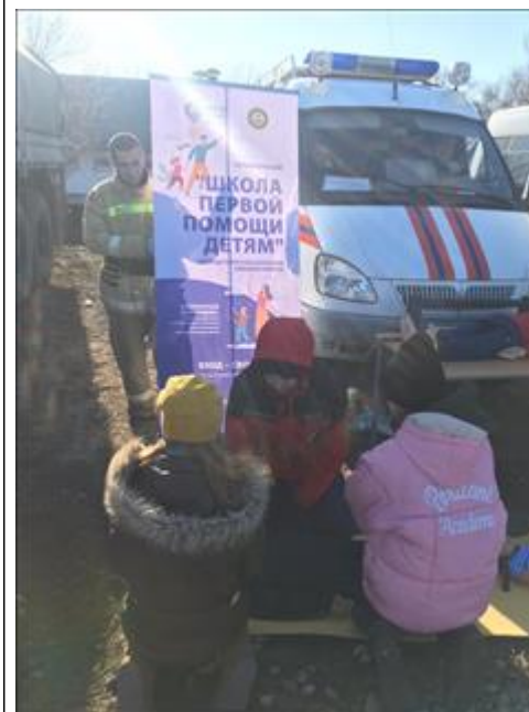
"Школа первой помощи детям" в рамках военно-исторического эпизода Великой О Регион проведения мероприятия: Ростовская область