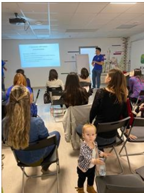
"Школа первой помощи детям" , Краснодарский край 29 февраля 2020 года