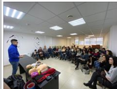
"Школа первой помощи детям", Краснодарский край 16 февраля 2020 года