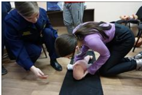
"Школа первой помощи детям", Республика Крым 20 декабря 2019 года