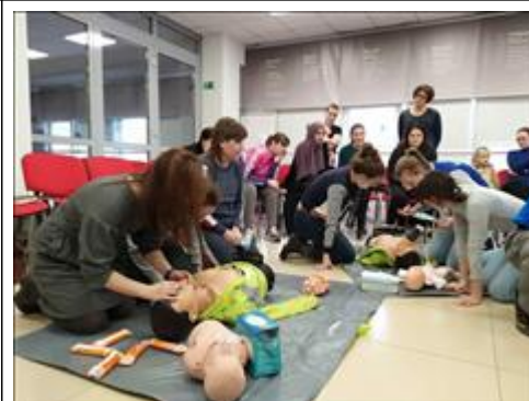
"Школа первой помощи детям", Ростовская область 22 февраля 2020 года