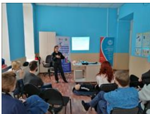
"Школа первой помощи детям", Свердловская область 29 января 2020 года