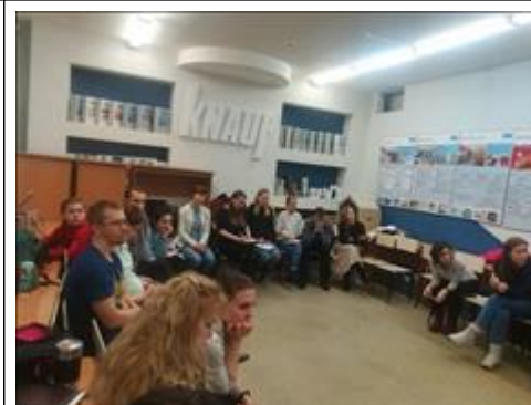
"Школа первой помощи детям", Архангельская область 16 февраля 2020 года