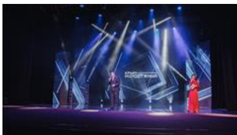
Проведение "Школы первой помощи детям" в рамках региональной премии "Крыммолодежный". Регион проведения: Республика Крым

Мероприятие: Участие не менее чем в 3 городских мероприятиях, праздниках в каждом из 5 регионов реализации проекта