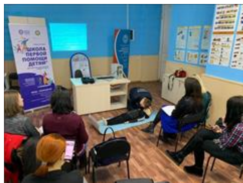
ролл-ап ролл-ап для добровольцев из Свердловской области