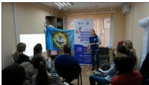
"Школа первой помощи детям", Республика Крым 29 января 2020 года