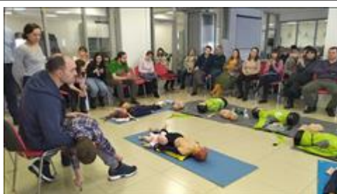
"Школа первой помощи детям", Ростовская область 8 февраля 2020 года