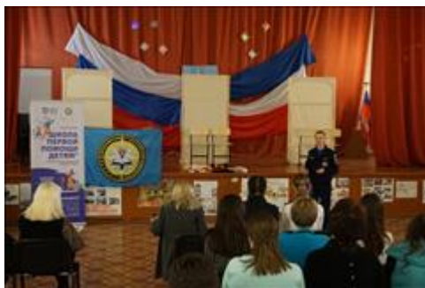
"Школа первой помощи детям", Республика Крым 21 февраля 2020 года