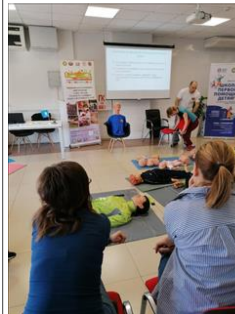
ролл-ап ролл-ап для добровольцев из Ростовской области