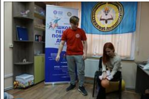
"Школа первой помощи детям", Республика Крым 24 января 2020 года