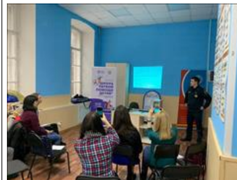
"Школа первой помощи детям", Свердловская область 22 января 2020 года