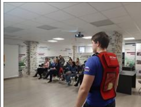
"Школа первой помощи детям", Краснодарский край 25 января 2020 года