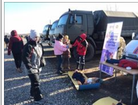
"Школа первой помощи детям" в рамках военно-исторического эпизода Великой Отечественной войны. Регион проведения мероприятия: Ростовская область