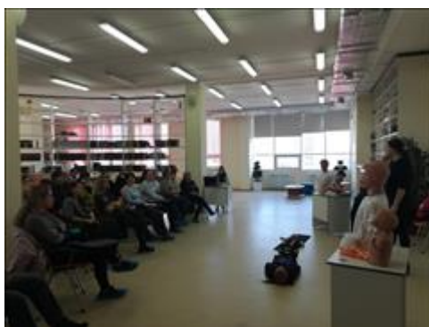
"Школа первой помощи детям", Ростовская область 16 декабря 2019 года