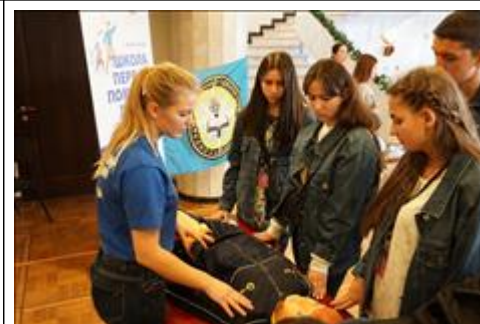
"Школа первой помощи детям", Республика Крым 17 декабря 2019 года