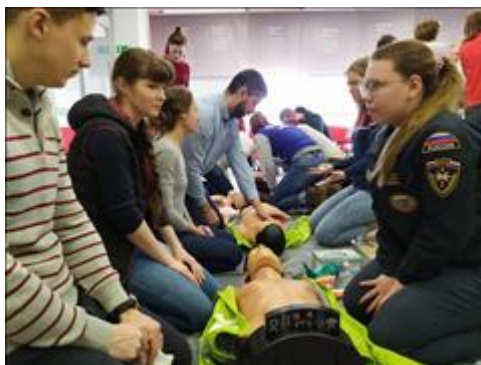
"Школа первой помощи детям", Ростовская область 17 декабря 2020 года