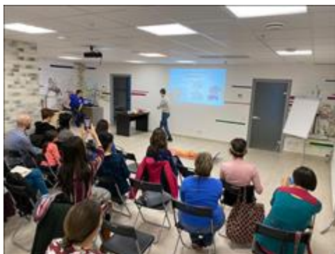
"Школа первой помощи детям", Краснодарский край 18 января 2020 года