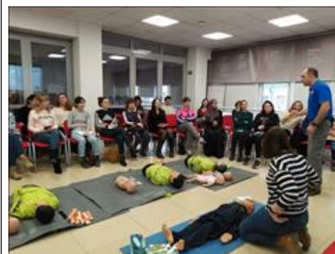
"Школа первой помощи детям", Ростовская область 25 января 2020 года