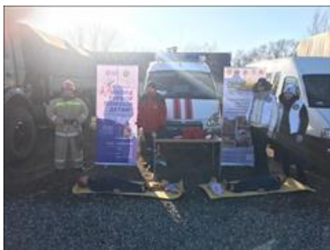
"Школа первой помощи детям" в рамках военно-исторического эпизода Великой Отечественной войны Регион проведения мероприятия: Ростовская область