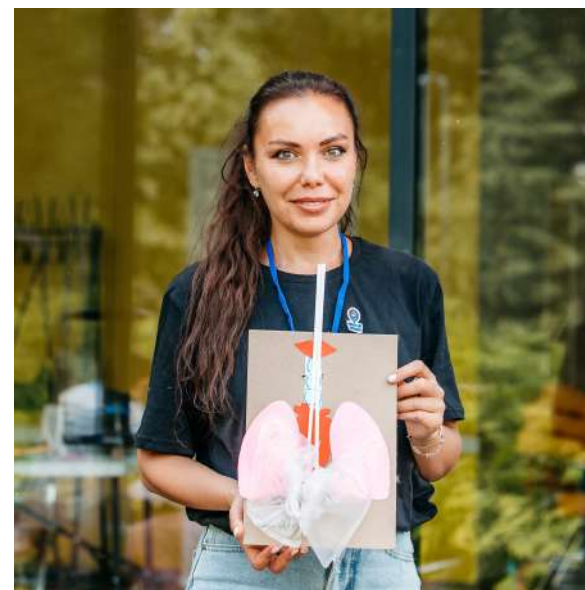
МАСТЕР-КЛАССЫ ДЕТСКИЕ: ДЫХАТЕЛЬНАЯ СИСТЕМА ЧЕЛОВЕКА