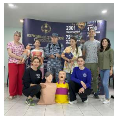
Республика Северная Осетия-Алания