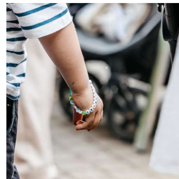
МАСТЕР-КЛАССЫ ДЕТСКИЕ: БРАСЛЕТЫ БЕЗОПАСНОСТИ