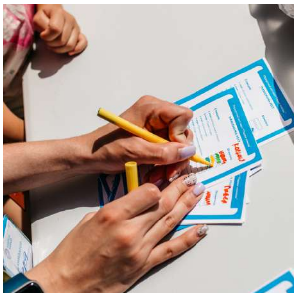
ИНТЕРАКТИВНЫЙ КВЕСТ: 7 СТАНЦИЙ С ЗАДАНИЯМИ ПО ПЕРВОЙ ПОМОЩИ