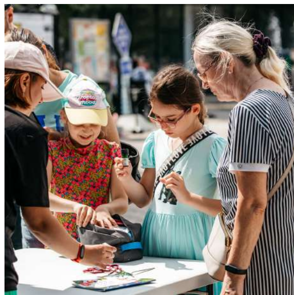
ОБУЧЕНИЕ ПЕРВОЙ ПОМОЩИ: ОТ СБОРА АПТЕЧКИ ДО ОСТАНОВКИ КРОВОТЕЧЕНИЯ